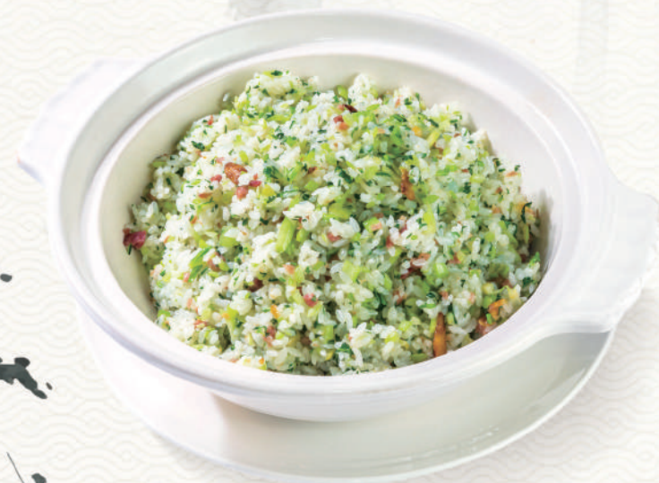
曉鹿鳴樓翡翠菜飯