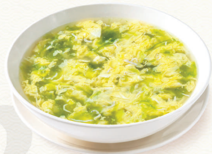
澎湖海菜吻仔魚湯